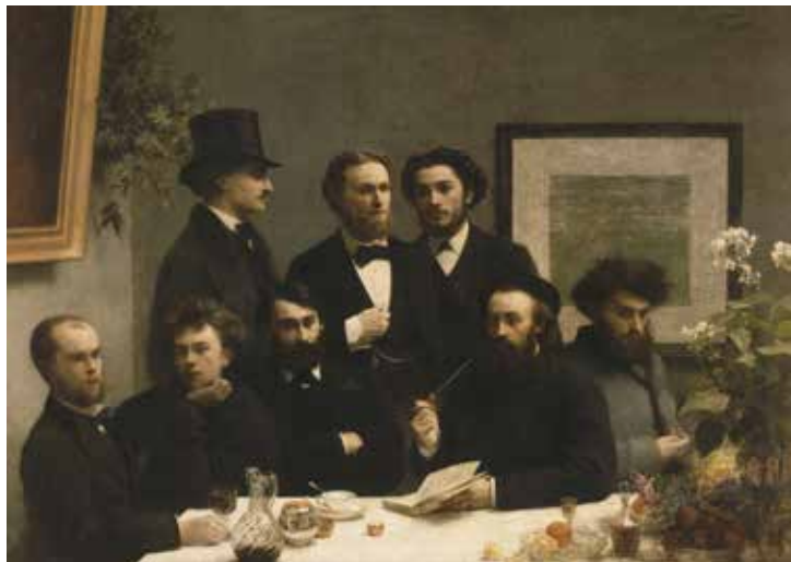
Henri Fantin-Latour, Un coin de table , 1872 (Paul Verlaine et Arthur Rimbaud à gauche du tableau)