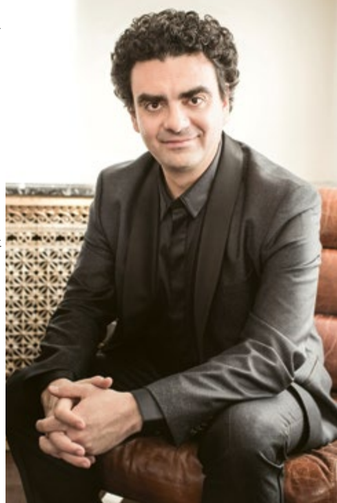
Rolando Villazón | photo: Dario Acosta, Deutsche Grammophon

Restaurant TEMPO Bar où manger (+352) 27 99 06 66 info@tempobaroumanger.lu www.tempobaroumanger.lu