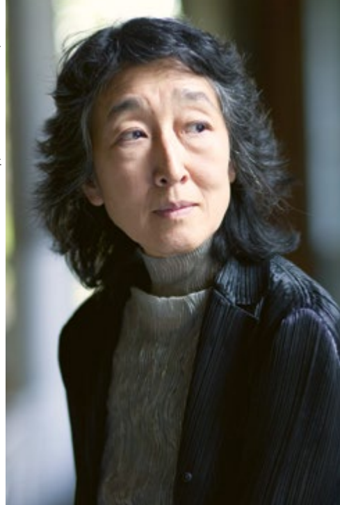
Mitsuko Uchida

Dass Musiker zu sein kein Beruf, sondern ein Akt der Hingabe ist, daran erinnert die Pianistin Mitsuko Uchida immer wieder gerne. Hingabe ist auch das zentrale Stichwort, wenn die Rede ist von Schuberts Klaviersonaten, denen sich die japanische Musikerin seit einigen Jahren widmet. Deren zyklische Aufführung wird sie nun am 20.10. in der Philharmonie Luxembourg abschließen. Ein Markstein des Klavierrepertoires wird somit von der wohl «wiennerischsten» Künstlerpersönlichkeit Japans interpretiert, die im Alter von 12 Jahren in die österreichische Hauptstadt kam und sich bald mit Leib und Seele dem deutschen Repertoire widmete, das mittlerweile den Dreh- und Angelpunkt ihres Wirkens bildet. Ein höchst bemerkenswerter Schlussakzent, der zudem den Start der Reihe «Récital de piano» markiert.