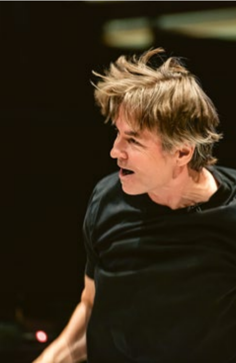
Esa-Pekka Salonen