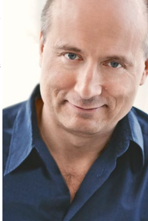
Paavo Järvi

Dass Richard Strauss neben zahlreichen Opern auch mehrere Ballette komponierte, ist kaum bekannt; Josephs Legende nach der Erzählung aus dem Alten Testament feierte 1914 in Paris mit Leonid Massine in der Hauptrolle Premiere und erreichte Jahrzehnte später das Interesse John Neumeiers. 1947 erstellte Strauss mit dem Symphonischen Fragment eine Fassung für den Konzertsaal. Über seine eigene Achte Symphonie sagte Anton Bruckner, sie sei sein «Mysterium», und in der Tat hat das gut achtzigminütige Werk manchen Zeitgenossen in Ratlosigkeit zurückgelassen, wohingegen es heute zu den Kronjuwelen der Symphonik im 19. Jahrhundert gerechnet wird. Vor dem Konzert um 18:15 wird der Film Maestro über Paavo Järvi in der Salle de Musique de Chambre gezeigt.