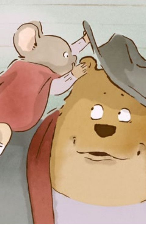
Film d'animation: Ernest et Célestine