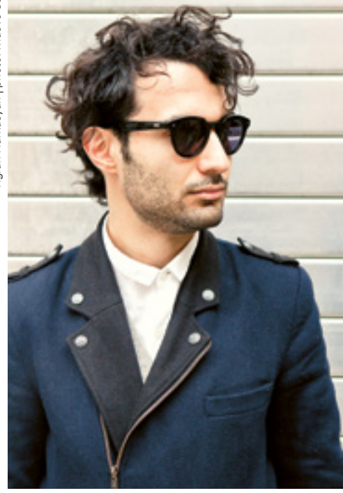
Tigran Hamasyan

«An diesem Wunderkind beeindruckt nicht nur die Technik, sondern auch seine Art, buchstäblich in die Noten einzutauchen, sie an seinen Fingerspitzen zu halten und sie in einem atemberaubenden Ballett wirbeln zu lassen» (Le Figaro). Es war in der Tat ein umwerfendes Ballett, dessen das Publikum 2017 teilhaftig wurde, als Tigran Hamasyan nach Luxemburg gekommen war, um sein Album «An Ancient Observer» vorzustellen. Am 22.11. kehrt der armenische Pianist nun in die Philharmonie zurück: zum einen mit seinem Jazztrio – Seite an Seite mit dem Orchestre Philharmonique du Luxembourg – zur Aufführung mehrerer seiner Kompositionen, andererseits nach dem Konzert – aber weiterhin auf der Bühne des Grand Auditorium – in einem intimeren Soloformat.