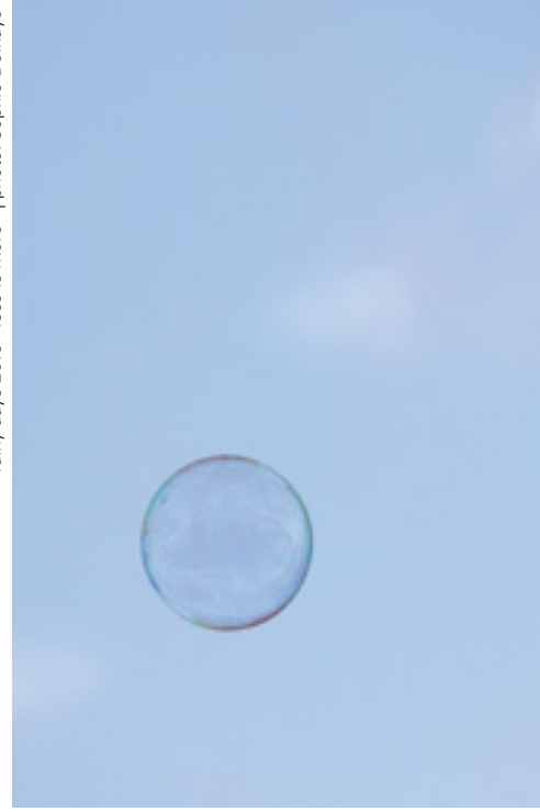
rainy days 2019 «less is more»

Nach dem Motto «less is more» konzentriert sich das Festival rainy days 2019 ganz auf das Wesentliche und erkundet Reduktion in zeitgenössischer Musik. 18 Konzerte, Installationen und Performances sowie zahlreiche Künstlergespräche und eine Konferenz laden dazu ein, zu erleben, wie künstlerisch fruchtbar Beschränkung sein kann. Das Festival präsentiert dabei herausragende Formationen wie das Pariser Ensemble intercontemporain, das Klangforum Wien, Les Percussions de Strasbourg oder das New Yorker Mivos Quartet. Vom Musiktheater Abstract Pieces mit wenigen Theatermitteln und dem Ciné-Concert L'Âge d'or über Drones des Minimal Music-Urgesteins Phill Niblock und politische Trickfilme bis zu Kinderkonzerten in der Dunkelheit reicht das Spektrum des Festivals. Manchmal ist mehr eben doch mehr.