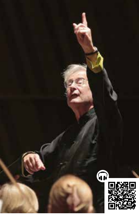
Sir John Eliot Gardiner