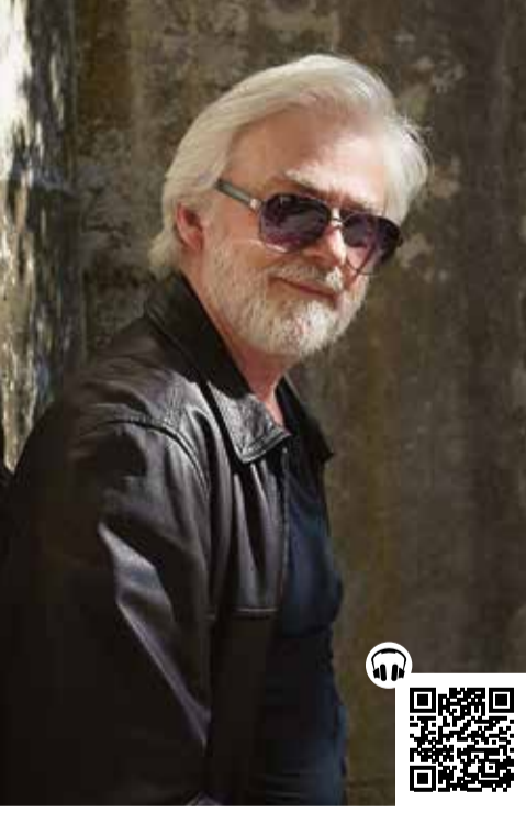
Krystian Zimerman