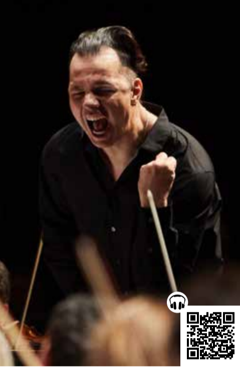
Teodor Currentzis