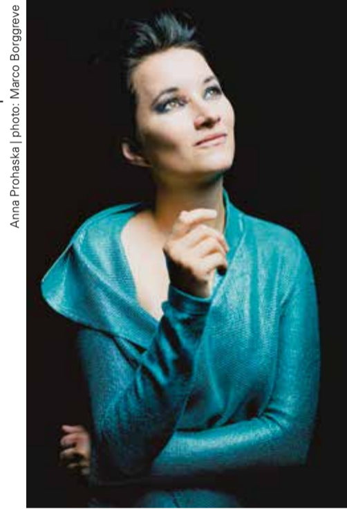
Anna Prohaska