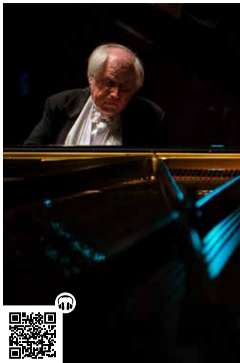
Grigory Sokolov

Durch seine exquisiten Interpretationen, aber auch durch das Einnehmen konsequenter Haltungen zu künstlerischen und politischen Fragen hat sich Grigory Sokolov als eine der am meisten respektierten Künstlerpersönlichkeiten unserer Tage profiliert. Im Grand Auditorium spielt er am 18.12. neben Werken von Johannes Brahms und Henry Purcell Ludwig van Beethovens frühe und gewichtige Variationen über ein eigenes Thema op. 35 , die wegen der späten Verwendung des Themas im Finale der Dritten Symphonie auch als « Eroica-Variationen » bekannt sind.