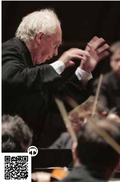
Philippe Herreweghe

In der Missa solemnis konnte sich Ludwig van Beethoven nicht kurz-fassen: ursprünglich für eine Aufführung in der Liturgie bestimmt, wuchs das Werk letztlich auf über 80 Minuten Länge an. Sein Schöpfer erkannte, dass diese Messe im Konzertsaal aufgeführt werden müsse, und so geschieht es nun einmal mehr in der Philharmonie, mit hochkarätigen Solist*innen, dem Collegium Vocale Gent und dem Orchestre des Champs-Élysées unter Philippe Herreweghe, der das Werk bereits 1995 eingespielt und seither immer wieder aufgeführt hat.