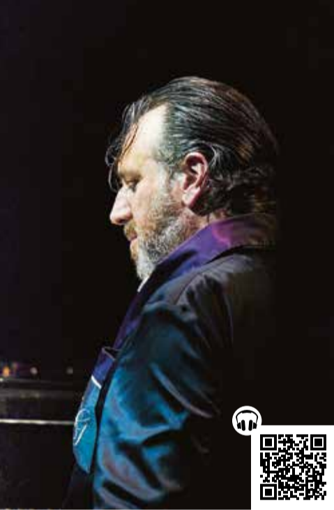
Chilly Gonzales