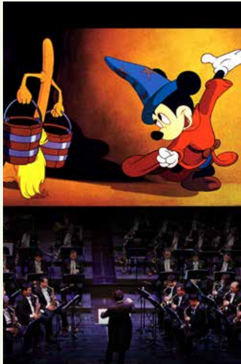
Film: Fantasia

Nashörner im Tütü, schlitzohrige Zentauren, eine von wildgewordenen Besen verfolgte Maus und ein furcht-einflößendes Monster – all diese Figuren bevölkern das Universum, das im Film Fantasia gezeigt wird. 1940 kam er in die Kinos, 1999 ging eine Fortsetzung an den Start. Mythologisches, Literarisches und Volkstümliches greifen ineinander, und alles wird mit Musik unterlegt, die den bedeutendsten Partituren des symphonischen Repertoires entnommen ist. Mit Ernst van Tiel bringt das Orchestre Philharmonique du Luxembourg den Soundtrack zum Klingen. Und die Klänge verbinden sich unwillkürlich mit Bildern, die Generationen von Cinephilen geprägt haben. Der Film wird zur Gänze am 16.12. gezeigt, in familienfreundlicher Kurzfassung dann im Vormittagskonzert am 17.12.