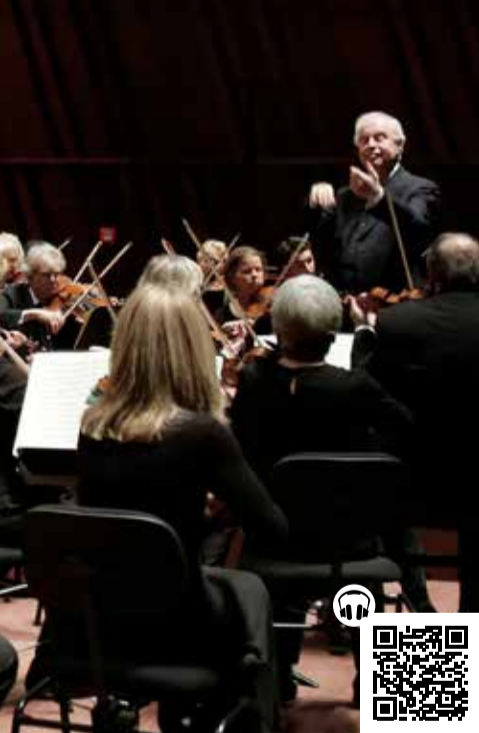
Cappella Andrea Barca, Sir Andrés Schiff