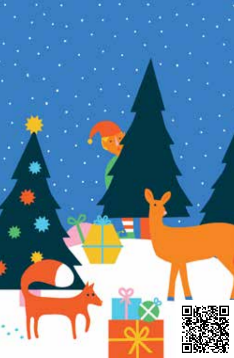
Illustration: Katharina Bourjau