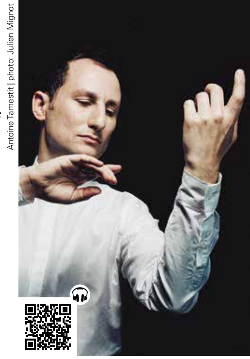
Antoine Tamestit

Von Hector Berlioz auf Wunsch Niccolò Paganinis komponiert, erscheint Harold en Italie als Symphonie mit der Bratsche im Mittelpunkt, die sich zum Echo des von Einsamkeit gequälten Helden macht. Wenn dieses Werk Antoine Tamestit am 31.01. auf die Pfade in den Abruzzen führt, so geschieht dies in Begleitung des Tonhalle Orchesters Zürich unter Paavo Järvi, das anschließend mit Johannes Brahms' Klavierquartett op. 25 und seinem Rondo «à la tzigane» den Weg Richtung Mitteleuropa einschlägt. Das Werk erklingt in der Orchestration von Arnold Schönberg. Dem Konzert geht um 19:15 ein Artist talk mit Antoine Tamestit in französischer Sprache in der Salle de Musique de Chambre voraus.