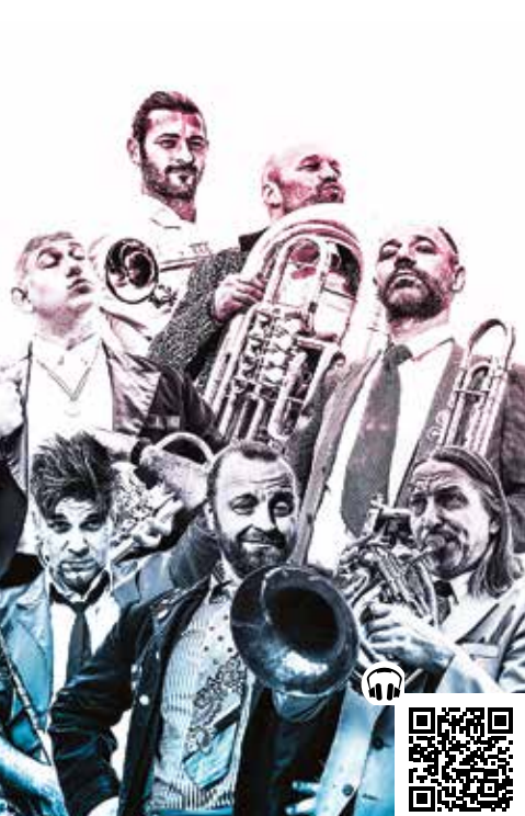
Mnozil Brass