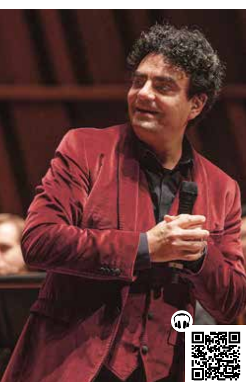
Rolando Villazón

Rolando Villazón hat viele Asse im Ärmel: er ist nicht nur Tenor, sondern auch Regisseur, Autor und Moderator in Radio und Fernsehen. Am 18.01. stellt der franko-mexikanische Tausend-sassa einmal mehr sein Erzähl-talent unter Beweis und mischt singend und sprechend Musikalisches, Erfahrenes und Anekdotisches, um das Publikum in die faszinierende Welt der Oper zu entführen. Mit Hilfe junger Musiker*innen und des Orchestre Philharmonique du Luxembourg gestaltet er nicht nur Momente puren Vergnügens, sondern stellt sich zugleich in den Dienst einer guten Sache: der Erlös des Kartenverkaufs für «Rolandopéra!» wird der Luxembourg Philharmonic Orchestra Academy zufließen.