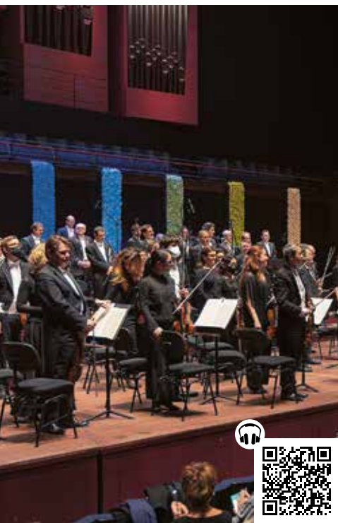
«Neijoersconcert»