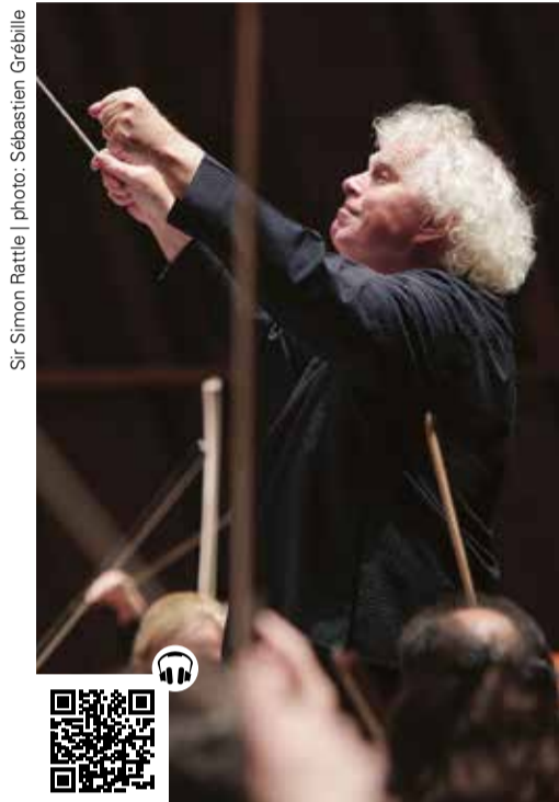
Sir Simon Rattle

Eines der Kernstücke aus Richard Wagners vierteiligem «Bühnenfestspiel» Der Ring des Nibelungen – Wegbereiter eines neuen Musiktheaterkonzepts, das nach weit über einem Jahrhundert noch immer zu polarisieren vermag. Doch nicht nur das – Siegfried ist ein Dokument subtilster Meisterschaft des Orchestrierens. Das Symphonieorchester des Bayerischen Rundfunks unter Sir Simon Rattle wird am 11.02. in Luxemburg dafür die Probe aufs Exempel liefern, wenn es in konzertanter Aufführung noch mehr der Rolle als zusätzlicher Protagonist neben einer herausragenden Sängerriege gerecht werden darf.