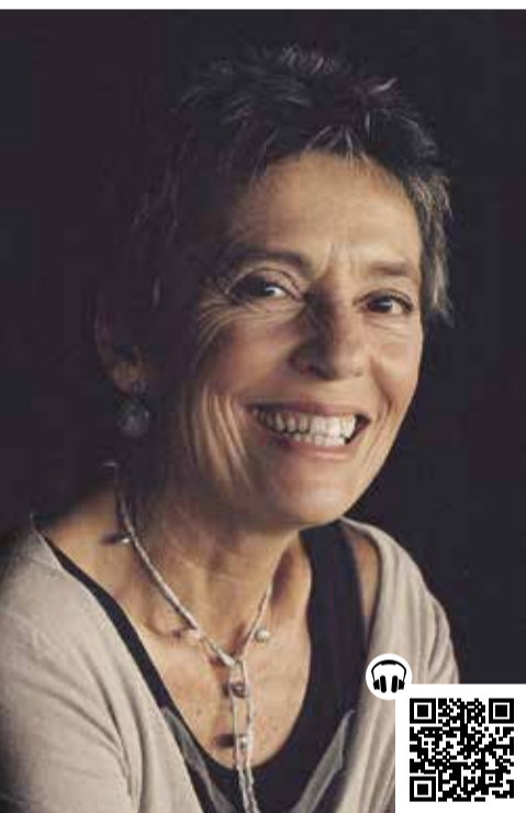
Maria João Pires