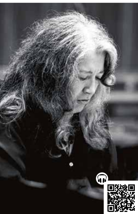
Martha Argerich