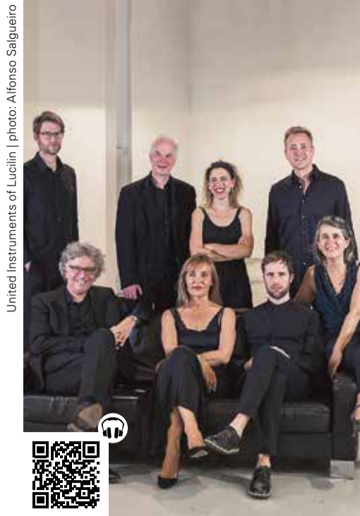
United Instruments of Lucilin

Ohne Frage zwei der bekanntesten und bedeutendsten kammermusikalischen Kompositionen des 20. Jahrhunderts – György Ligeti's Aventures und Nowvelles Aventures haben ihren Weg ins Repertoire weit über die Avantgarde-Szene hinaus längst gefunden. Im Konzert der United Instruments of Lucilin treten diese Schlüsselkompositionen in Beziehung zu zwei deutlich jüngeren Werken aus der Feder des Japaners Yu Oda bzw. der Ukrainerin Anna Korsun. Entdeckergeist im allerpositivsten Sinne des Wortes durchflutet also am 07.02. die Salle de Musique de Chambre, wenn die Luxemburger Spezialist*innen für neue Musik zu neuen Abenteuern aufbrechen bzw. alte Abenteuer neu erleben lassen.