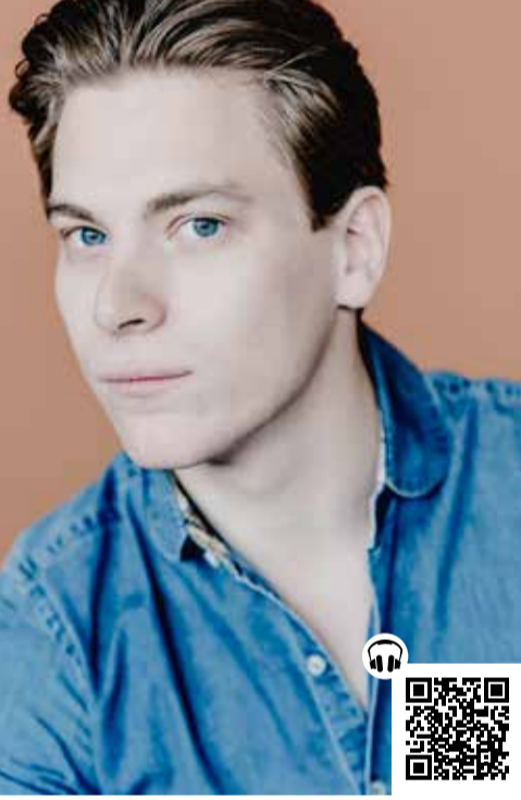
Klaus Mäkelä

Er ist ein Shooting Star der Dirigierszene: Klaus Mäkelä gilt mit gerade einmal 27 Jahren bereits als Spezialist für die Musik seines Landsmannes Jean Sibelius. Mit dessen Musik und dem Orchestre de Paris kommt der junge Musiker am 06.03. nach Luxemburg. Als Solistin des Konzerts für Violine und Orchester des Finnen kehrt Janine Jansen zurück ins Grand Auditorium. Im zweiten Teil des Abends bietet Hector Berlioz' Symphonie fantastique dem Dirigenten Gelegenheit, sich als Klangmagier zu betätigen und in kräftigen Farben dieses ebenso markante wie vielschichtige Epos zu gestalten.