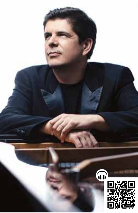
Javier Perianes

2023 steht für das Orchestre Philharmonique du Luxembourg auch im Zeichen der polnischen Musik: nach Witold Lutoslawski ist es am 10.03. Karol Szymanowski, der mit seiner Vierten Symphonie (Symphonie concertante) – die eigentlich ein Konzert für Klavier und Orchester ist – auf dem Programm steht. Für den Solopart kehrt der andalusische Pianist Javier Perianes nach Luxemburg zurück. Vor dem Werk des auch als « polnischer Debussy » bekannten Komponisten erklingt Prélude à l'après-midi d'un faune aus der Feder des Franzosen. Die Fünfte Symphonie Pjotr Iljitsch Tschaikowskys beschließt den Abend, dem um 19:15 in der Salle de Musique de Chambre ein Künstlergespräch in englischer Sprache mit dem Dirigenten und dem Solisten vorausgeht.