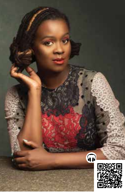
Somi

Die Südafrikanerin Miriam Makeba hat über ihre ganze Karriere hinweg gezeigt, dass sich Musikmachen und politisches Engagement nicht ausschließen. Vom Apartheid-Regime für über dreißig Jahre Exil abgedrängt, setzte sie sich immer für Freiheit ein. An Makebas bedeutendes musikalisches Erbe knüpft nun die ugandisch-ruandische Sängerin Somi an, im vollen Bewusstsein darüber, dass Makebas kraftvolle Stimme « nicht nur ihre eigene Entwicklung geprägt hat, sondern auch diejenige zahlreicher anderer afrikanischer Künstlerinnen und Künstler ». Am 12.03. erweist Somi der auch « Mama Afrika » genannten Makeba ihre Reverenz, natürlich mit einer ganz individuellen, zeitgenössischen Note und im Spannungsfeld zwischen Jazz und traditioneller Musik.