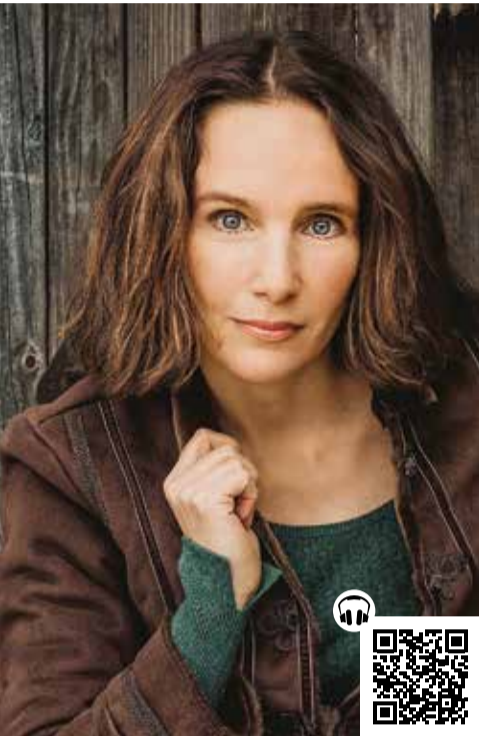
Hélène Grimaud