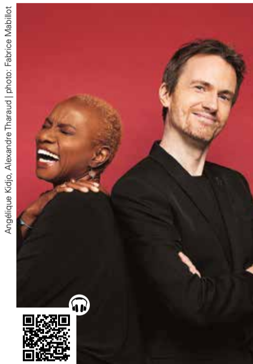
Angélique Kidjo, Alexandre Tharaud

Im Mittelpunkt des Konzerts von Angélique Kidjo und Alexandre Tharaud stehen die Liebe, die dazugehörigen Worte und das dazugehörige Leiden. Diese beiden Künstler, die gern Projekte an der Schnittstelle verschiedener Stile durchführen, gehen eine explosive, aber dennoch folgerichtige Allianz ein. So spielte Tharaud eine CD mit Werken Erik Saties ein, auf der mit Juliette eine weitere Sängerin zu Wort kommt, und die Aufnahme «Angélique Kidjo sings with the Orchestre Philharmonique du Luxembourg» wurde 2016 mit einem Grammy Award ausgezeichnet. Diese Begegnung rund um die von Josephine Baker, Édith Piaf oder Claude Nougaro besungene Liebe ist ein weiterer Schritt auf zwei künstlerischen Wegen, die sich hier auf glückhafte Weise kreuzen.