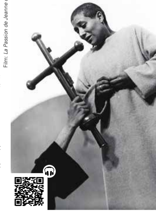
Film: La Passion de Jeanne d'Arc