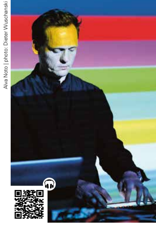
Alva Noto