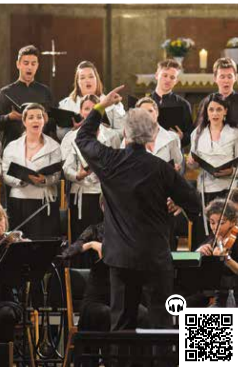
Monteverdi Choir, Sir John Eliot Gardiner

Tickets (dès le 02.02.): 10 € (adultes 15 €) – Pour enfants seuls ou accompagnés