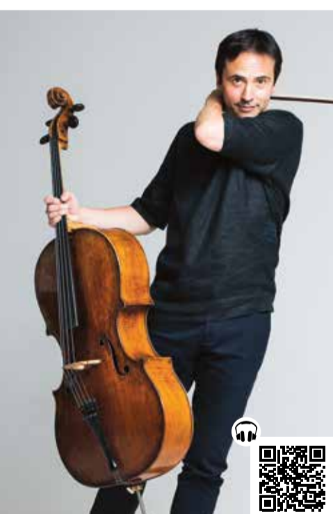
Jean-Guihen Queyras