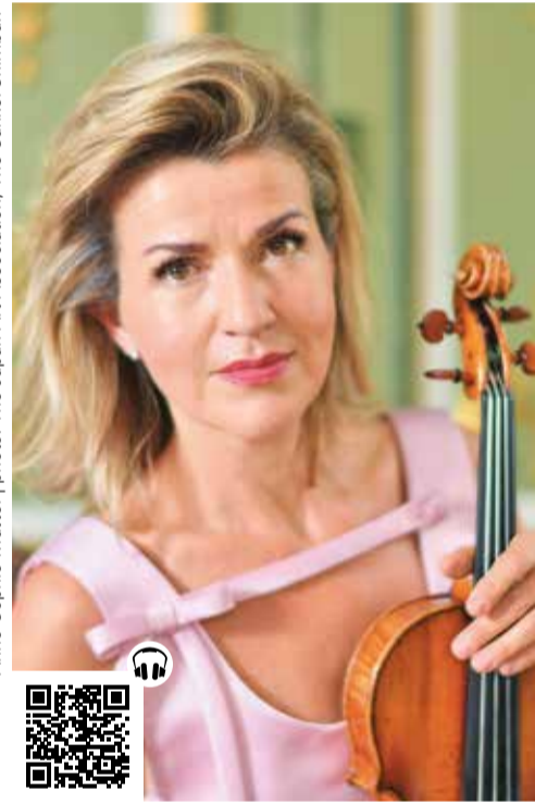
Anne-Sophie Mutter