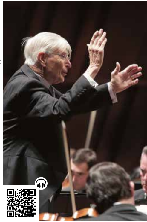
Herbert Blomstedt

Doyen der Dirigentenwelt, kehrt Herbert Blomstedt dieses Mal an der Spitze des Chamber Orchestra of Europe in die Philharmonie zurück, das die Idee des vereinten Europas musikalisch verkörpert und sich in den Dienst der gleichermaßen eleganten wie inspirierten Interpretationen des legendären Dirigenten stellt: am 26.05. mit der Vierten Symphonie von dessen schwedischem Landsmann Franz Berwald und Felix Mendelssohn Bartholdys « Schottischer » Symphonie . Eröffnet wird der Abend um 18:00 in der Salle de Musique de Chambre mit dem aus Anlass von Blomstedts 95. Geburtstag realisierten Filmporträt Wenn die Musik tönt, wird die Seele angesprochen .