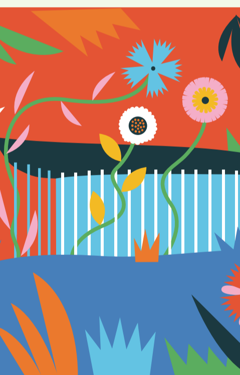
illustration: Katharina Bourjau