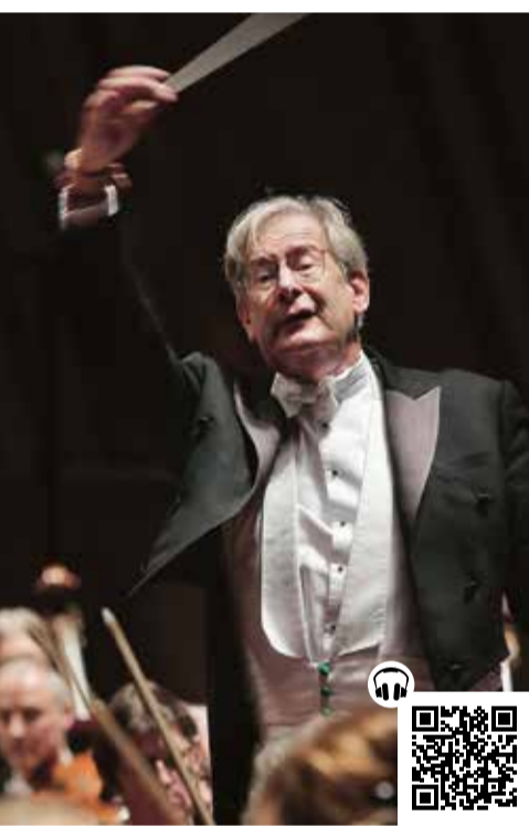
Sir John Eliot Gardiner