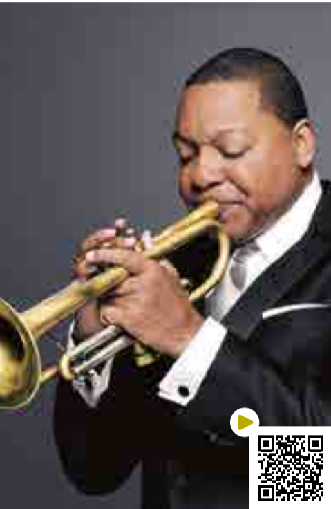
Wynton Marsalis

Wir wünschen Ihnen eine erholsame Sommerpause und freuen uns, Sie zur Eröffnung der 18. Spielzeit wieder in der Philharmonie willkommen zu heißen