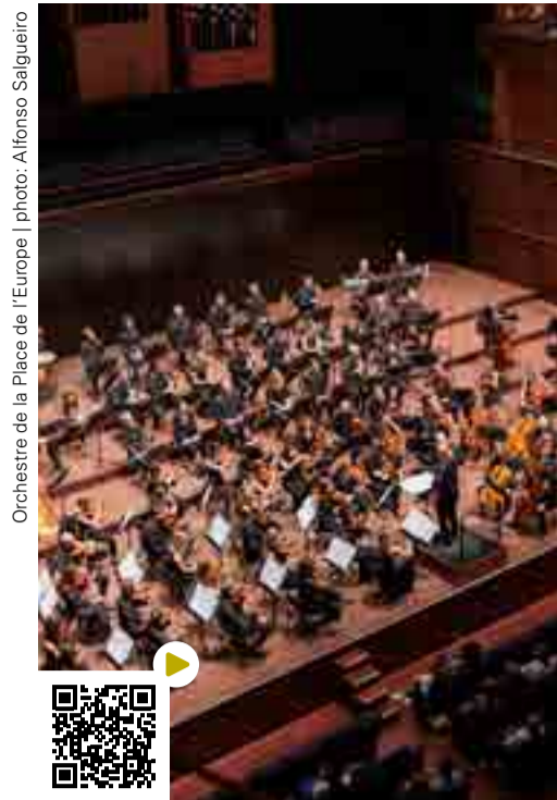
Orchestre de la Place de l'Europe

«Ein Amateur-Symphonieorchester von erstaunlicher Qualität», urteilte im letzten Juni Pizzicato anlässlich des ersten Konzerts des Orchestre de la Place de l'Europe, eines Klangkörpers aus Liebhabern, der einige Monate zuvor durch die Philharmonie Luxembourg ins Leben gerufen worden war. Durch den Erfolg bestärkt, haben die Musiker ihr Abenteuer fortgesetzt und abermals unter Leitung von Benjamin Schäfer, Schlagzeuger des Orchestre Philharmonique du Luxembourg, ein Konzertprogramm erarbeitet, das sie im Grand Auditorium präsentieren werden. Um zu wissen, ob dies wie 2022 «tosenden Beifall und Standing Ovations» hervorruft, ist nur eines notwendig: am 17.06. in der Philharmonie dabeizusein.