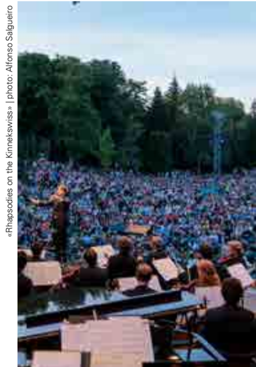
«Rhapsodies on the Kinnekswiss»

Was gibt es Schöneres an einem lauen Sommerabend, als sich mit einem Picknick-Korb auf der lauschigen Kinnekswiss niederzulassen und sich durch – noch dazu von herausragenden Interpreten dargebotene – Musik bezaubern zu lassen? Auch die aktuelle Saison in Luxemburg werden das Orchestre Philharmonique du Luxembourg und Gustavo Gimeno wieder inmitten des Parks im Herzen der Stadt beschließen. An ihrer Seite die Ausnahmepianistin Yuja Wang mit der mitreißenden Paganini-Rhapsodie von Sergej Rachmaninov. Nicht weniger mitreißend, doch obendrein augenzwinkernd beschwingt geht es im zweiten Teil des Abends zu – mit Richard Strauss' Rosenkavalier -Suite und Maurice Ravels La Valse .