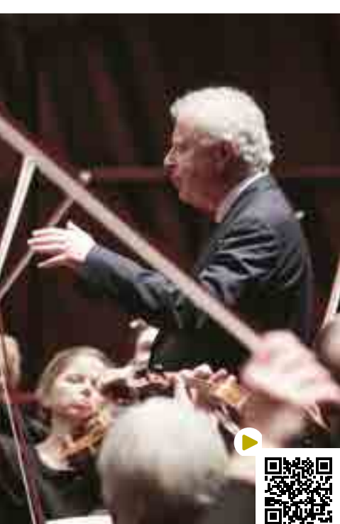
Sir Andrés Schiff