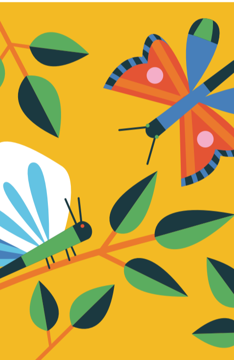
Illustration: Katharina Bourjau